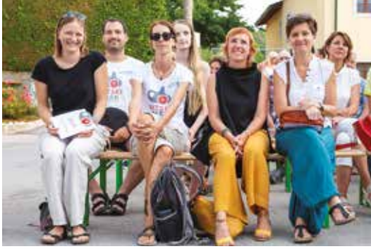
Avtorska skupina ob odprtju parka.